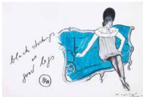
Karl Lagerfeld, Anna Piaggi , 1986, tecnica mista

Il percorso espositivo termina con uno sguardo al futuro, attraverso i progetti elaborati dagli studenti dell' Accademia Albertina di Belle Arti , dello IAAD e dello IED sul tema del cappello.